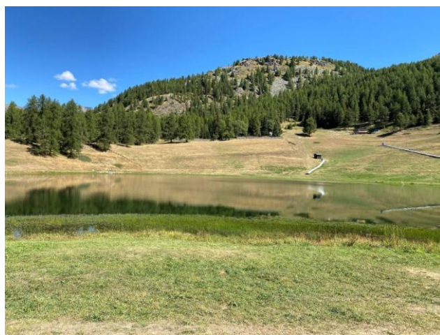
Lago di Lod