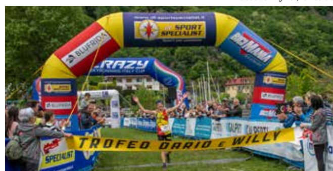
Fotoclub G. Anghileri, Valmadrera