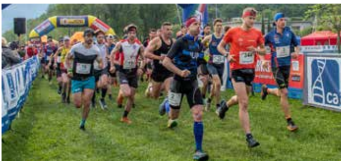
Fotoclub G. Anghileri, Valmadrera