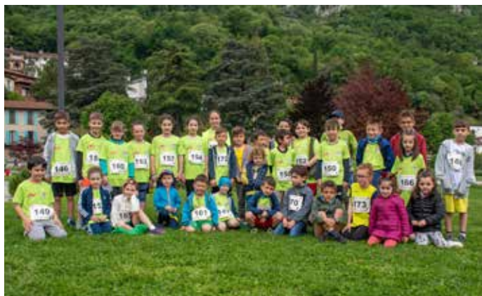
Fotoclub G. Anghileri, Valmadrera