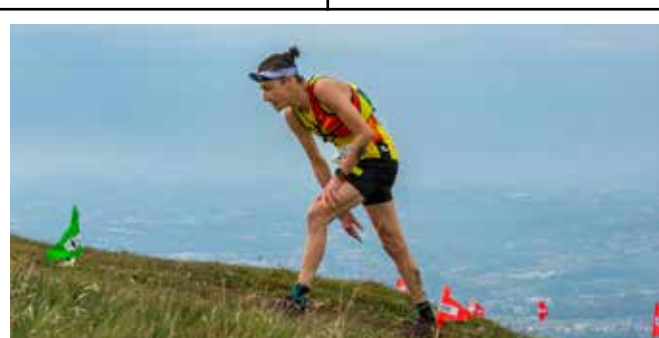
Fotoclub G. Anghileri, Valmadrera