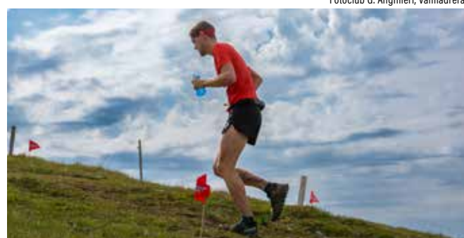
Fotoclub G. Anghileri, Valmadrera