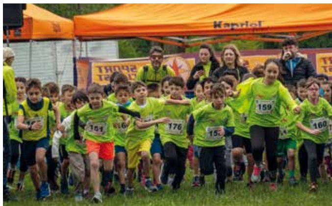
Fotoclub G. Anghileri, Valmadrera