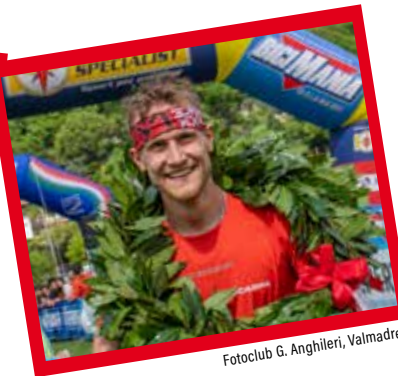
Fotoclub G. Anghileri, Valmadrera