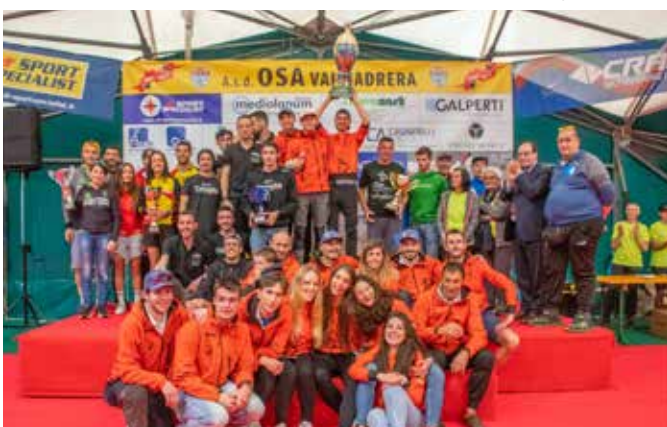
Fotoclub G. Anghileri, Valmadrera